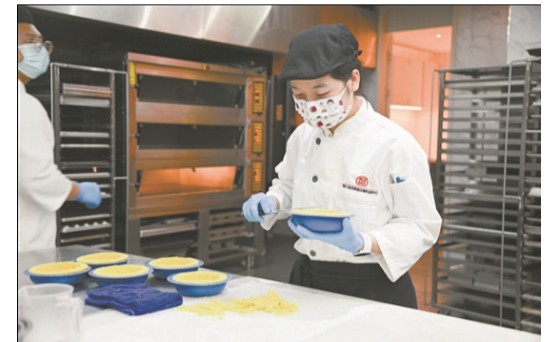
近年來,美心集團等港資企業選擇在江門投資。圖為美心集團員工在制作糕點美食。

與澳門合作方面,江門則提出,要主動對接澳門“1+4”產業適度多元發展戰略,打造大灣區“一程多站”精品文旅線路,加強大健康、高新技術、食品加工等產業合作,為共建國際一流灣區和世界級城市群注入新