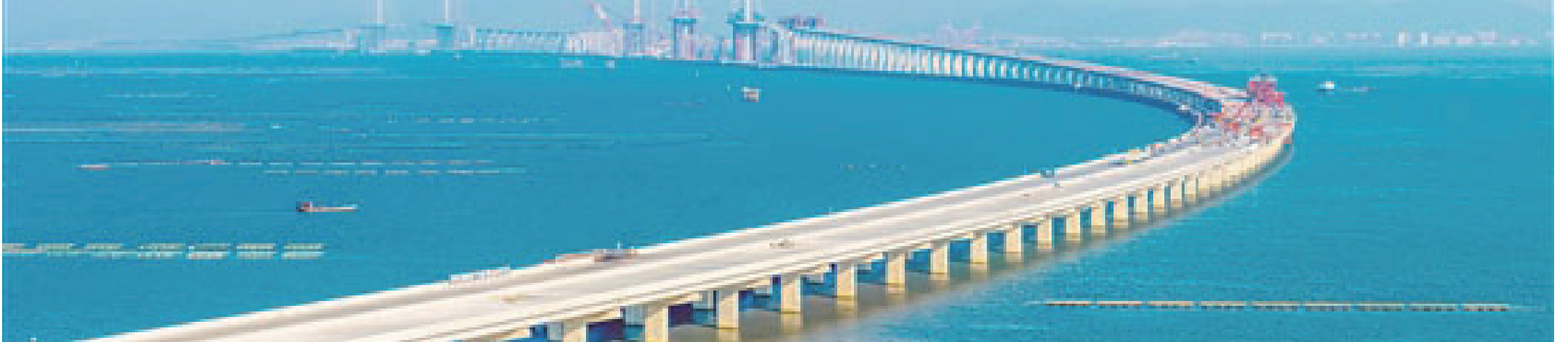
黃茅海跨海通道預計明年建成通車,屆時將進一步拉近江門與港澳的時空距離。